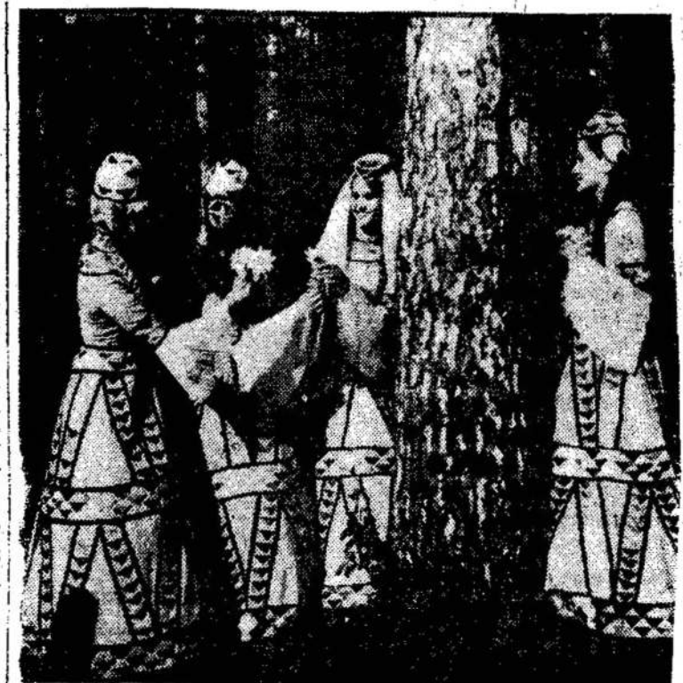
Lietuvos TSR Valstybinio nusipelnusio dainų ir šokių liaudies ansamblio "Lietuva" skambia daina ir grakščiu šoku gėrėjosi šimtai tūkstančių gyventojų broliškose Tarybų šalies respublikose, jiems plojo Lenkijos, Rumunijos, Čekoslovakijos, Belgijos, Kanados, Kubos, Meksikos ir daugelio kitų šalių žiūrovai.

Po keletos dienų mes išvykstame į savo tėvynę. Palikdami Amerikos kontinentą siunčiame karštus linkėjimus visiems pažangiesiems lietuviams-sportininkams ir mėgėjams ir "Litudies Balsas" skaitytojams.