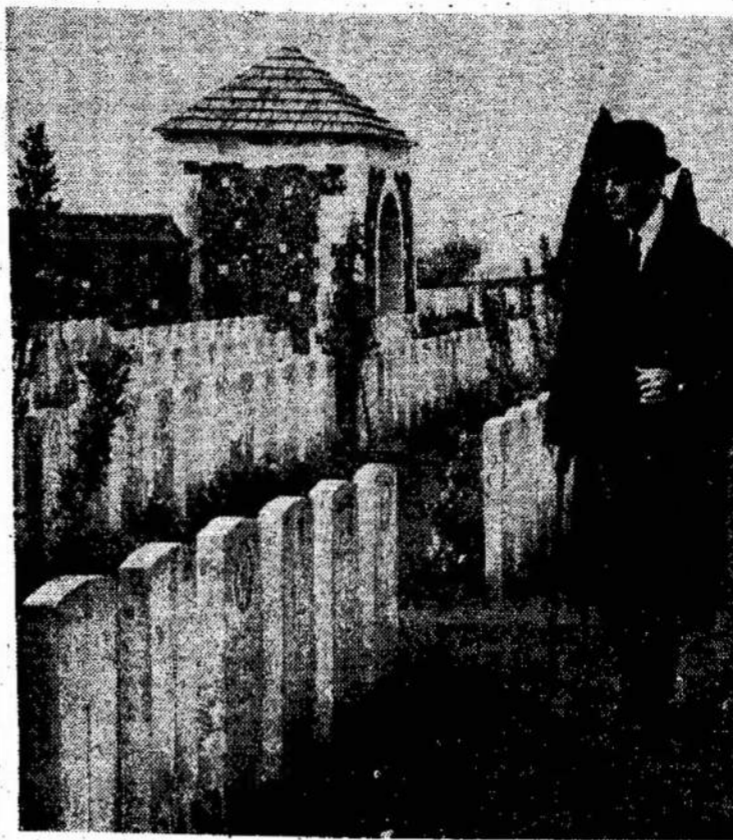
Kanadoj gimęs aktorius Raymond Massey, pirmo pasaulinio karo veteranas, prie Kanados karių paminklo Europoj. Pirmadienį televizija davė specialią programą paminėjimui to karo ir kanadiečių, kritusių tame kare.

Veikiausiai Mrs. Onassis mažai paisy Vatikano, bet visgi,