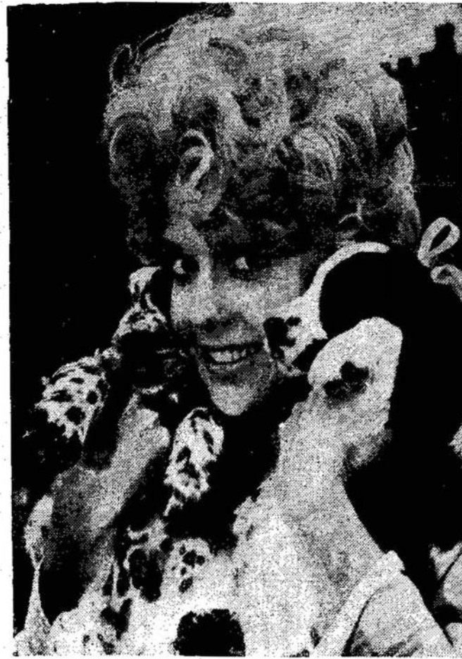
Elly May Clampett, viena iš televizijos spektaklio "Everly Hillbillies" žvaigždžių, su savo "draugais".

Bet ar amerikiečių jėgos Pietų Vietname nešaudytų šiaurės Vietnamo žvalgybinių orlaivių? Labai abejotina. Su tuo jie nesutiktų. Tokiu būdu, kol amerikiečiai nėra davę leidimo šiauriečiams žvalgyti pietinę dalį, jie negali reikalauti, kad šiauriečiai nekludytų amerikiečių žvalgybiniam orlavams.