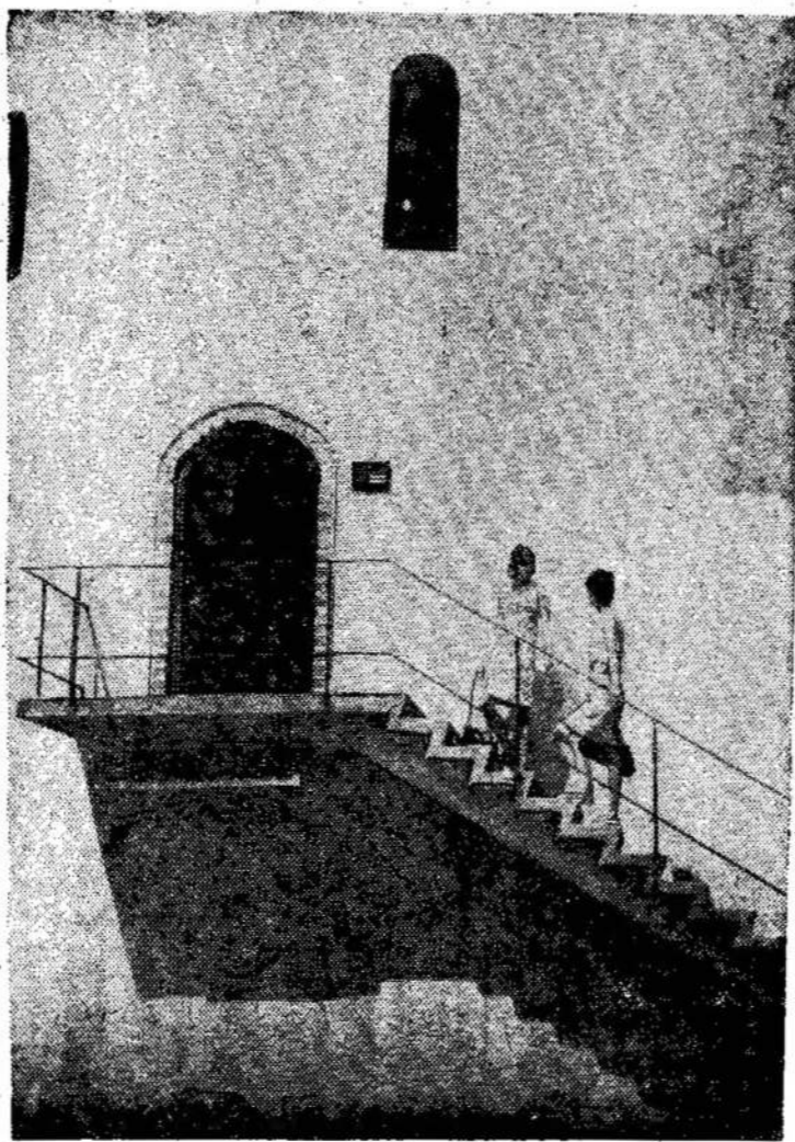
Prie senosios katedros varpinės Vilniuje.

Nebuvimas jo atvaizdo reiškia didelę nepagarbą prezidentui.