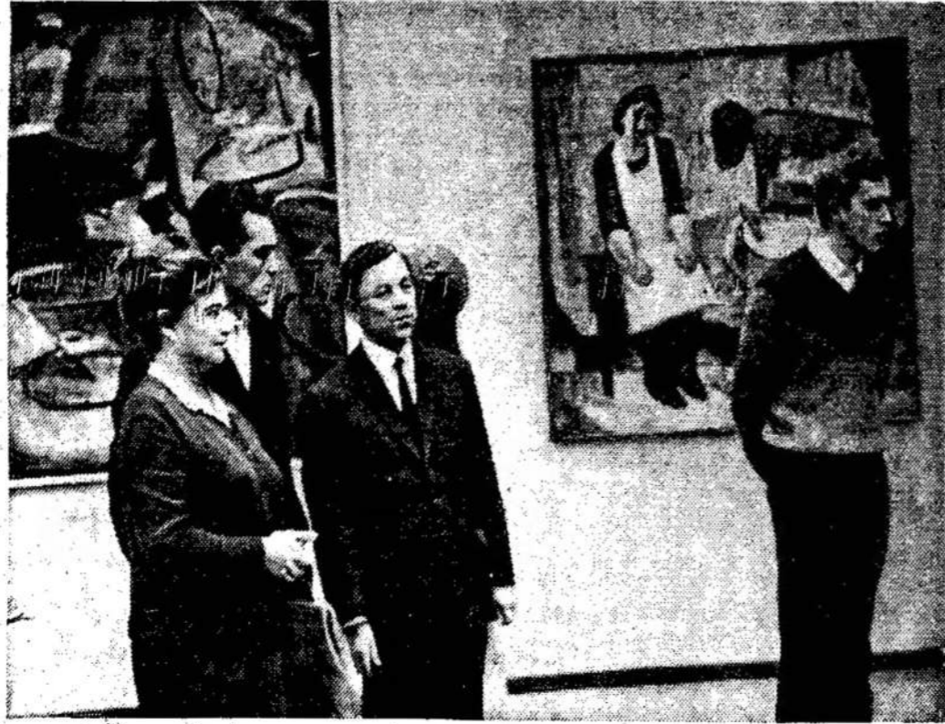
Parodų rūmuose Vilniuje veiksponuojama daugiau kaip 400 tapybos, grafikos, skulptūros darbų, atspindinčių Lietuvos komjaunimo kovas praėjusio ir darbo žygį darbus, jaunimo gyvenimą. lankytojai apžiūri parodą.