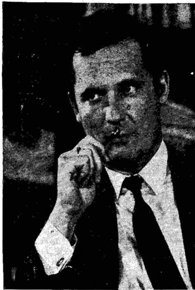
John Vernon, aktorius, kurs televizijos pastatymuose vaidina Steve Wojcek. Pastatymas, apimęs 10 savaičių, bus pakartotas vėl, pradėdamas viduriu vasario. Aktorius dabar gyvena ir dirba Hollywoode.

Nežinau, ar verta dėl to neigti premjerą, kad madų vaikytojai jį tuo titulu vainikuoja?