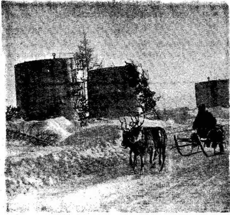
Nafta turtingos Siaurės keliu.

Po viskuom, daug kam buvo džiugu padraugauti su artiste televizijos režisore Stase Go-