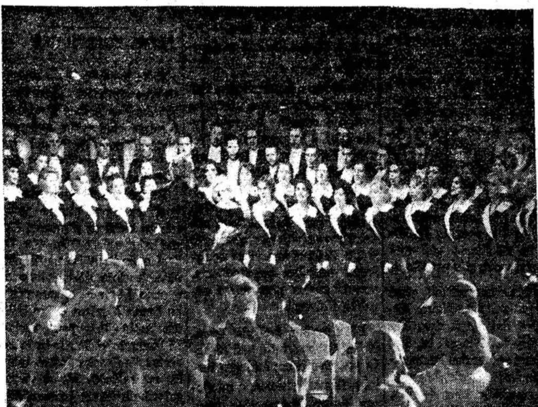
Valstybinis Radijo ir televizijos komiteto choras koncertuoja Šakiuose.

Liaudies Balsas, 160 Claremont St., Toronto 3, Ont., Canada