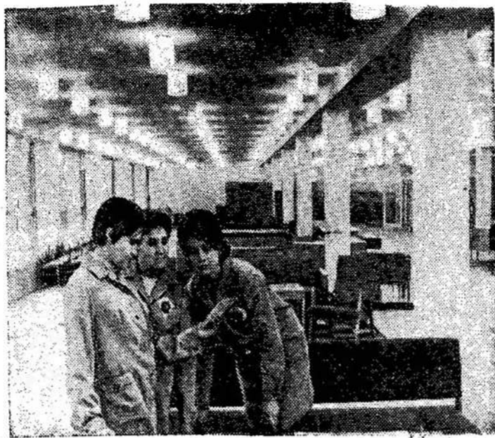
Kaune, Lenino prospekte, atvėrė duris didžiausia miesto parduotuvė. Tai — keturių aukštų pastatas iš surenkamojo gelžbetonio ir stiklo. Parduotuvėje galima įsigyti naujų rūšių baldų, šaldytuvų, siuvimo ir skalbimo mašinų, ciklotos prekių ir kita.

NEW DELHI. -- Bendras frontas, [kur] įeina ir komunistai, laimėjo rinkimus Vakarų Bengalijoje.