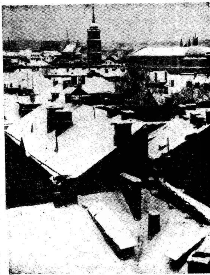
Vilniaus senamiestis žiemą

L. P. Landry, specialus pro- kuroras, sako, kad Montrea- le nuo 1960 iki 1968 metų buvo 75 ligoniai, apsinuodiję mariju-