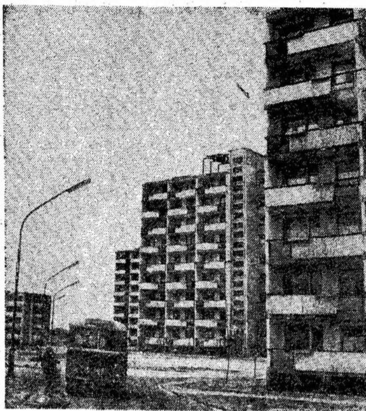
taip atrodo naujasis Vilniaus rajonas Žirmūnai.