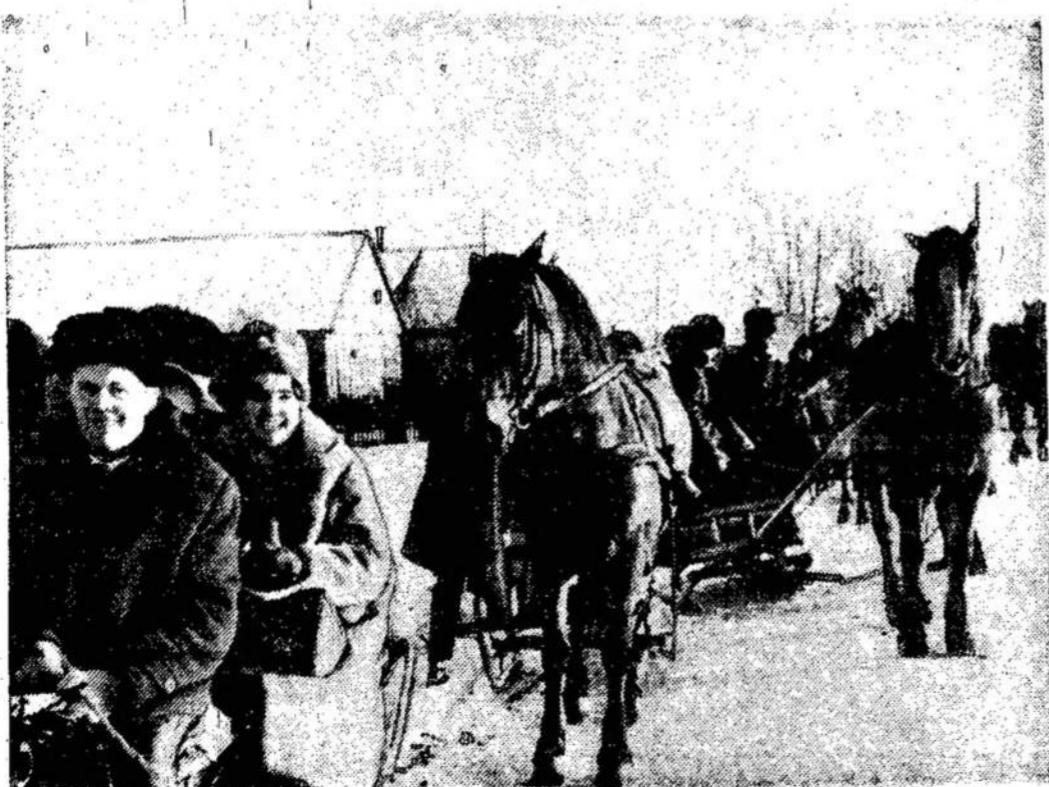
Smagu žiemą pasivažinėti rogėmis.

Liaudies Balsas, 160 Claremont St., Toronto 3, Ont., Canada