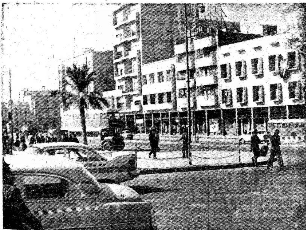
Bagdadas, sostinė Irako, vienas arabų šalių, kurios jau daug metų pergyvena vidurinėmis neramumais, o prie to prisideda ir nesutikimai su Izraeliu.

Liaudies Balsas, 160 Claremont St., Toronto 3, Ont., Canada