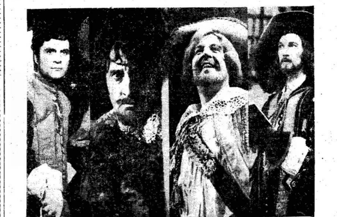
Stratfordo Nacionalio Teatro televizijos tinklas perduos trečiadienį, kovo 19. Tai dramatiška garsiosios Aleksandro Dumas novelės. Nuotraukoje — keli charakteriai.

Kovo 14 T Iš Arim... 900 vo... veldrinių k... tko karo... pateko ne... jas nepas... Narai j... parengta Dabar I... 000 trakto... ūkičiams... 1948 m Susižeid... praėjusiai... 000. Workme... ryba prar... metais Or... ninkų ir c... žeidę ir r... jos. Fort V... nuo atei... dienos bu... Ontari... ba nutar... sudarytu... administ... Miesto... Lakehea... gyventojų MIAM... kalnys į... vį skrist... leivijų. V... atimdami... Kumb... ta haidž... žino nuk... Ta pa... srityje:... vėrių m... negrų k... baltųjų... m min... negrų j... jų 75 pr... Siuo r... turi bal... negrų, v... rinkta į... lande, C... rai išrir... ašcuoni... sėjų, pr... valdinir... Aukščia... vienas ;... Karit... tai neg... teikta l... muštų... pe yra... to jie sl... čia į... vietas... Vald... čiuoja... JAV č... bus dvi... bar yra... jų prie... tųjų... Ame... ilgai į... gyveni... baltais