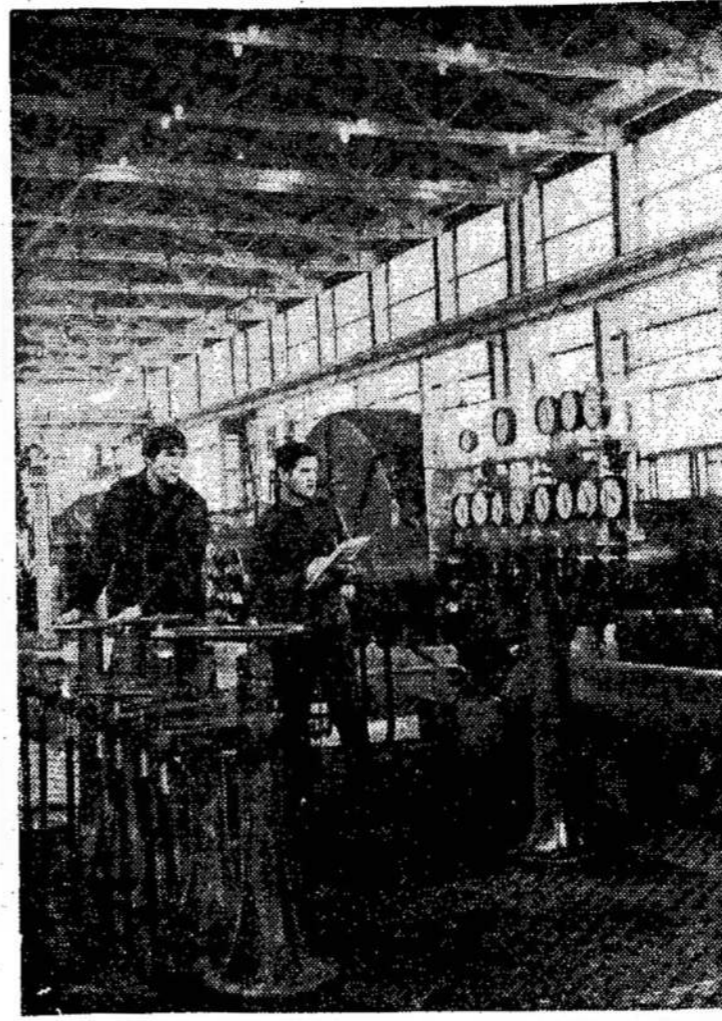
Jonavos azotinių trąšų gamykloje.

Žmonės sako: Kas vėją sėja, tas audrą piauna. Kinijos lyderiai tikrai vėjus gaudo. Jau dabar daugelį draugų atstūmė.