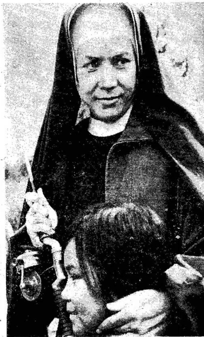
Scena iš filmo "Miss Powlan", kuris bus perduotas per televiziją kovo 26. Filmą pavaizduoja indijonų gyvenimą Yukono Teritorijoje, toli šiaurvakarinėje Kanadoje.

Kanados vyriausybė, svarstydama klausimą, prigulėti prie NATO ar neprigulėti, turėtų sujungti ir fermerių klausimą. Jeigu tie pinigai, kurie išleidžiami kariuomenės palaikymui Europoje, būtų paskirti šelpimui alkanių, tai Kanadoje javų perteklius žymiai sumažėtų. Farmeriams nereikėtų bėgti nuo savo žemės arba mažinti javų laukus.