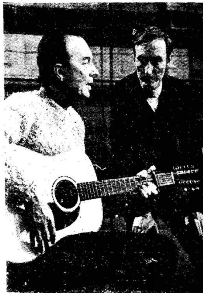
Pagarsėjęs gitaristas ir dainininkas Pete Seeger kalbasi su CBC televizijos prodiuseriu Paddy Sampson apie programą, kurią Seeger duos ant televizijos gegužės 12.