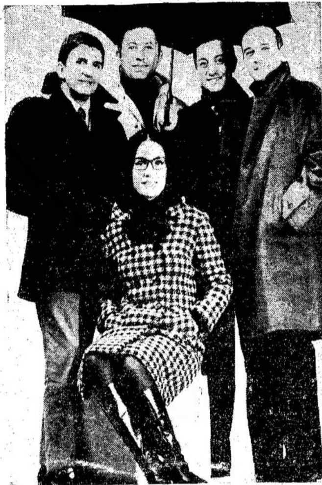
Graikų dainininkė Nana Mouskouri duos programą ant CBC radio gegužės 18 dieną. Čia ji matoma su grupe, kuri padės jai pildyti programą.

Skridimas į Mėnulį įvyks į pabaigą gegužės. Bet šiuo sykiu nebus bandoma nusileisti ant Mėnulio.