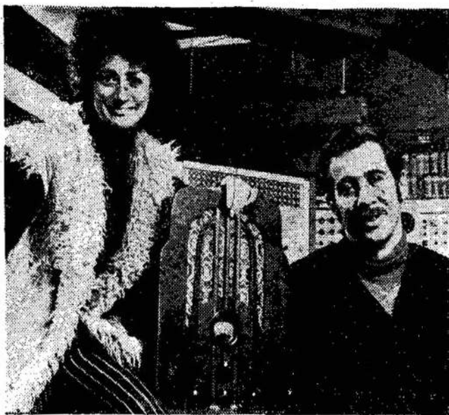
Louise Delisle ir Peter Gzowski, CBC aktoriai, prie seno radijo imtuvo.