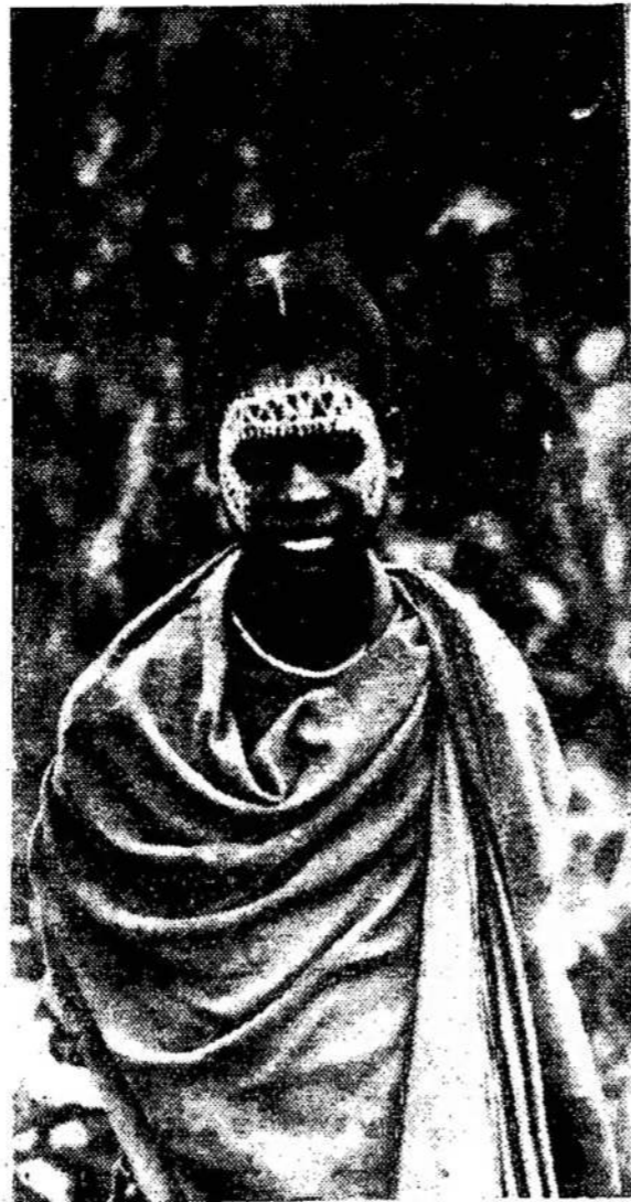
Tanzanijos respublika. Prie Kilimandžaro kalnų gyvenanti čagų gentis iki šiol laikosi senovinio papročio — įšventinti vaikus į vyrus. Įšventinimo dienomis čagų genties vaikinai apsiengia tautiniais drabužiais, o veidus išspaiso baltais dažais.