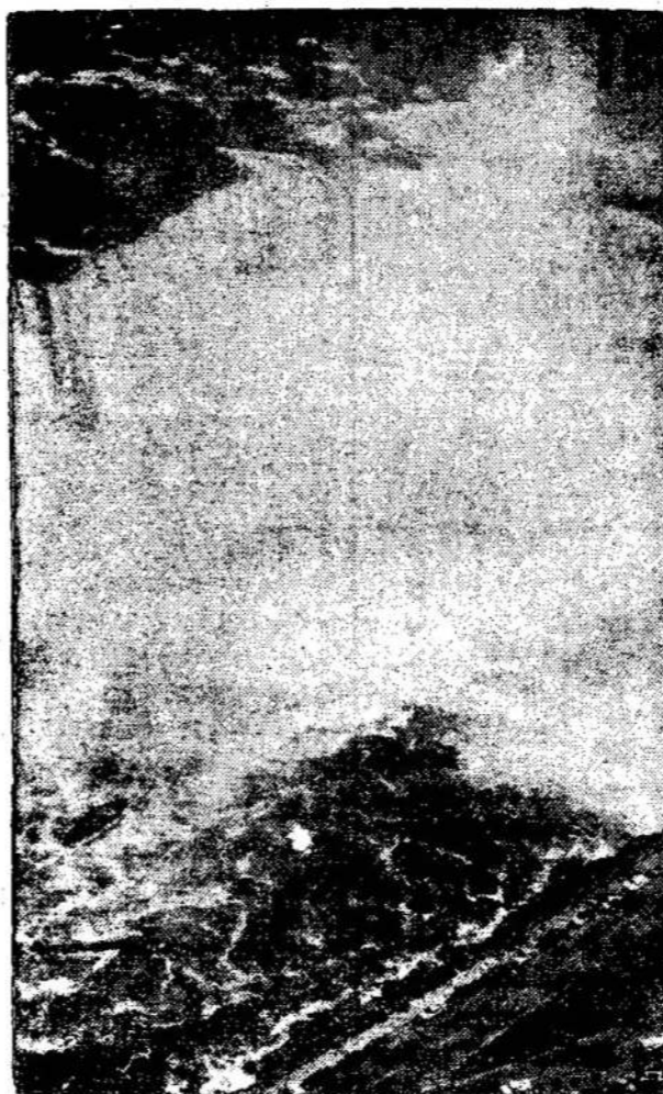
Niagaros Krioklio vaizdas, žiūrint iš stebėjimų bokšto.

Liaudies Balsas, 160 Claremont St., Toronto 3, Ont., Canada