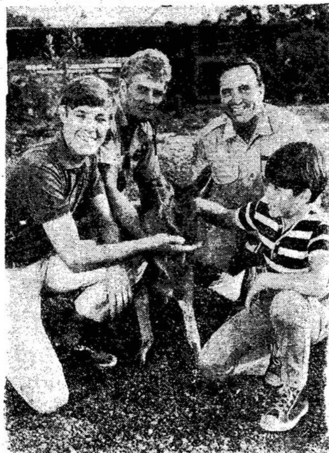
Aktoriai, kurie vaidina televizijos pastatyme "Skippy, The Bush Kangaroo". Filmai gaminami Warath Nacionaliniame Parke, netoli Sidney, Australijoje.

Viskam brangstant, dėl šių jų reikalavimų mažai kas juos