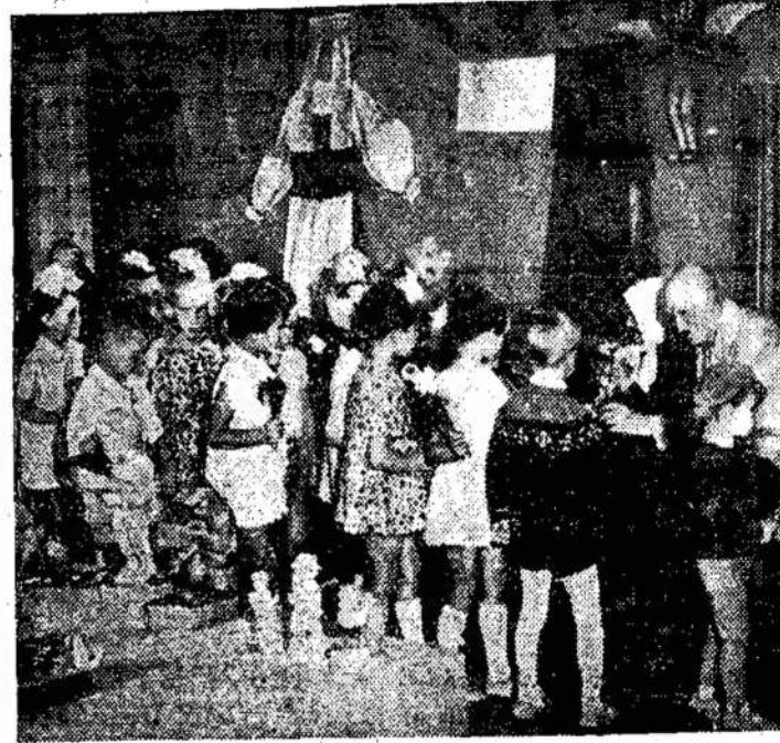
Kretingoje veikė liaudies meno paroda. A. Tumėno nuotraukoje: šimtamečių parodos svečius sveikina mažieji miesto gyventojai.

Aš per šiuos metus taip pat nesėdėjau rankas sudėjęs. Nors jau einu penkiasdešimtuosius metus ir sekančiais metais gegužės 3 d. švėsiu penkiasdešimtmetį, bet priverčiau save mokytis vakarais, o kartais net ir naktimis, nes dienomis reikėjo dirbti, ir galiu pasigirti, kad mano triušas ir nemigo naktys nenuėjo veltui. Šių metų vasa-