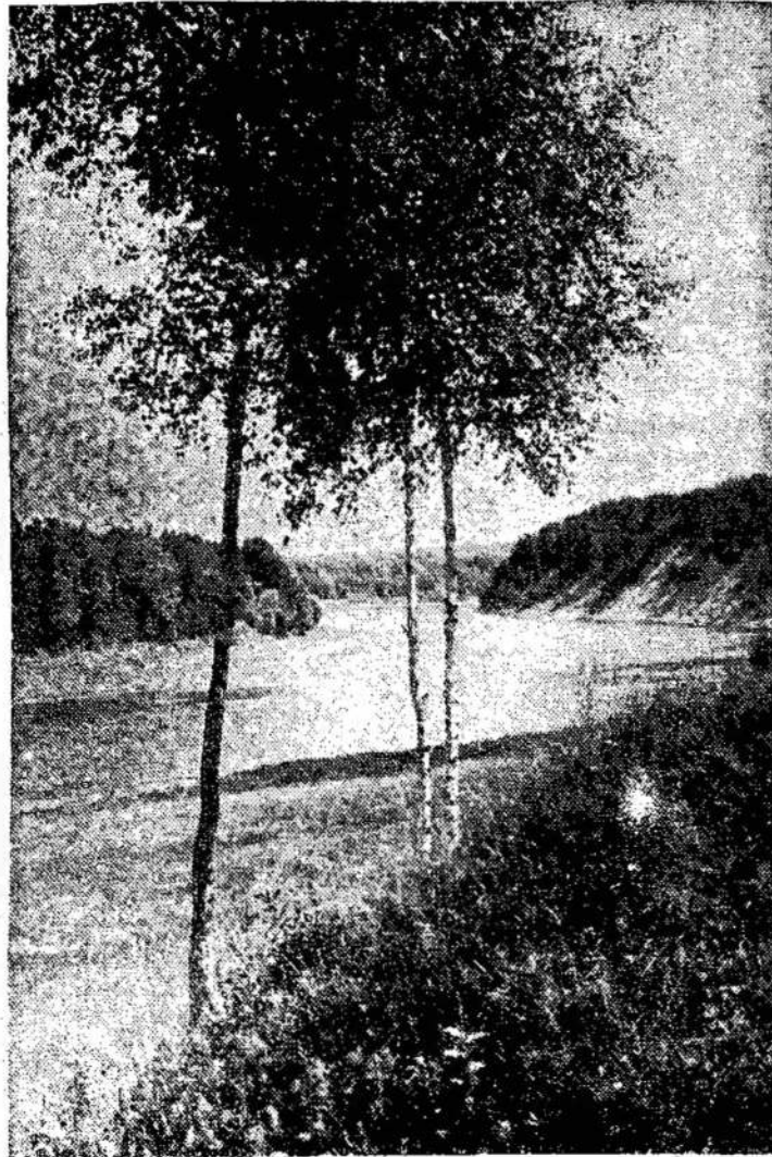
Nemunas ties Punia