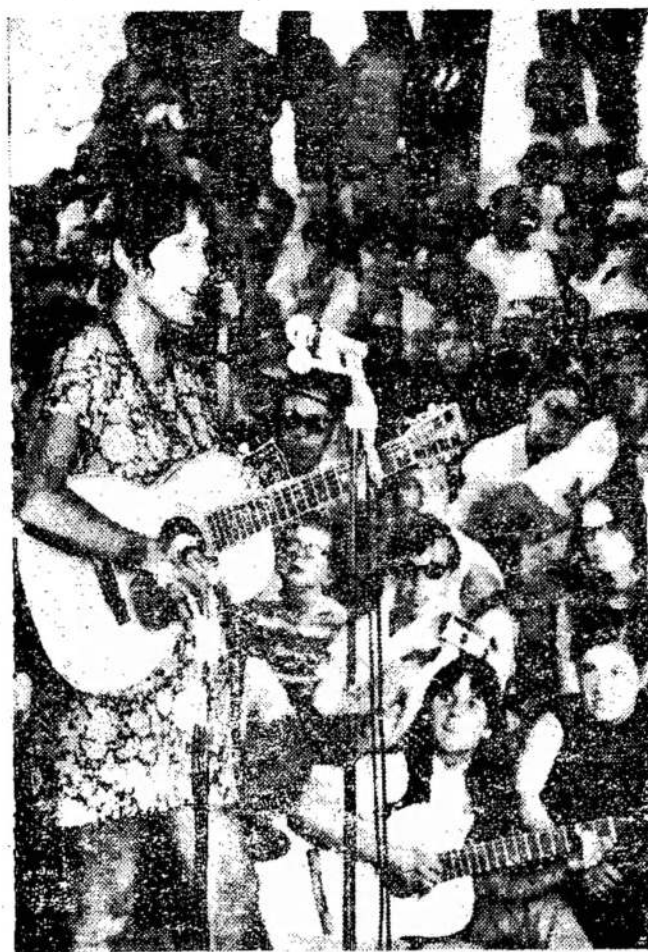
Joan Baez, plačiai išgarsėjusi dainininkė, matoma dainuojant Mariposa Folk Festivalyje, kur įvyko ant Toronto salos. Ją bus galima matyti ir girdėti ant televizijos rugsėjo 28 dieną 10 v. v. ant CBC stočių.