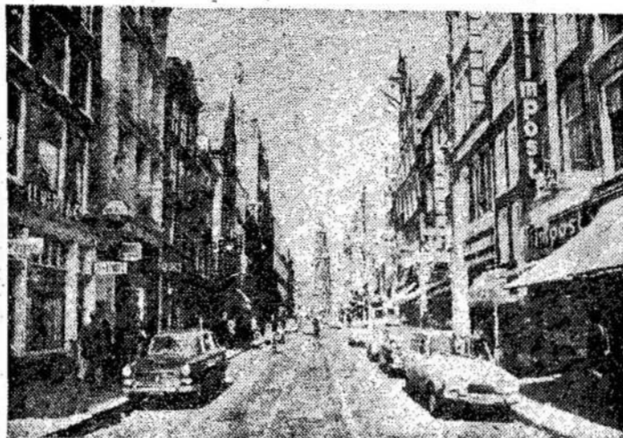
Viena centrinių Olandijos sostinės — Amsterdamo gatvių.