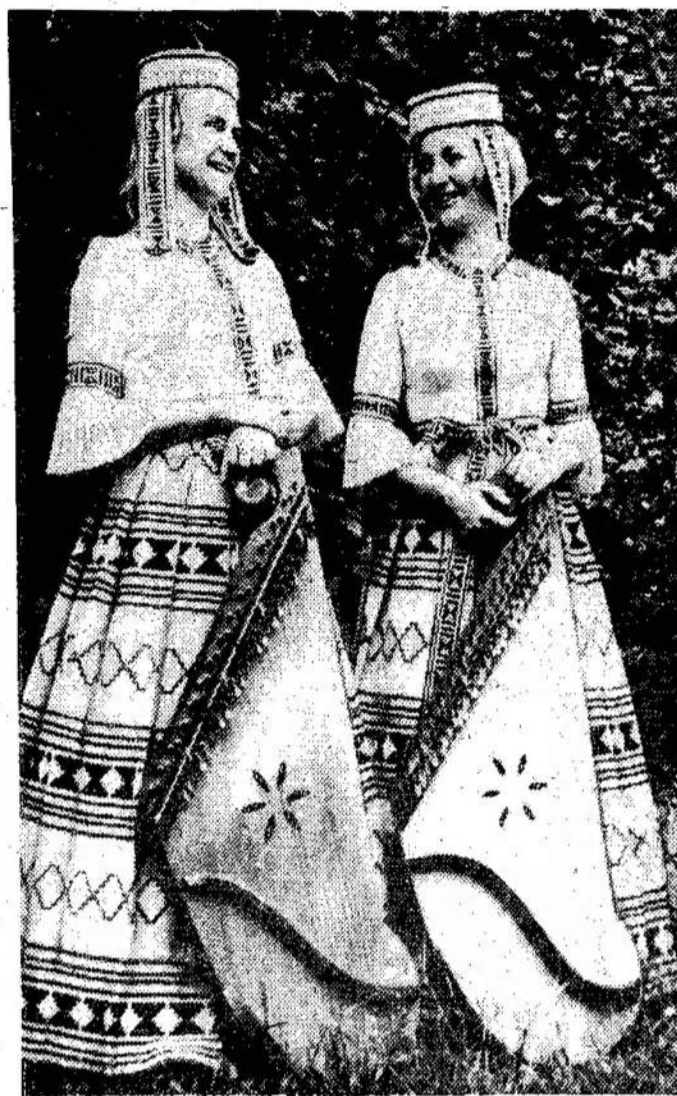
Lietuvių liaudies dainų ir šokių ansamblio "Lietuva" kanklininkės.

Sis titulas jai davė jau $6,500, o modeliavimas duosiąs jai apie $78,000. Apsimoka būti pasauline gražuole.