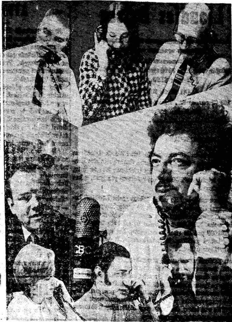
Kanados radijo (CBC) programai. Programa prduodama 8:30 gramos "As it Happens" veikė val. vakaro vietos laiku.

Kitai sakant, kompanijai nereikės mokėti taksų, kol ji išsireiškė investuoti milijonus. O paskui ji gali parduoti tai įmonę ar ką kitą ir vėl pradėti iš naujo.