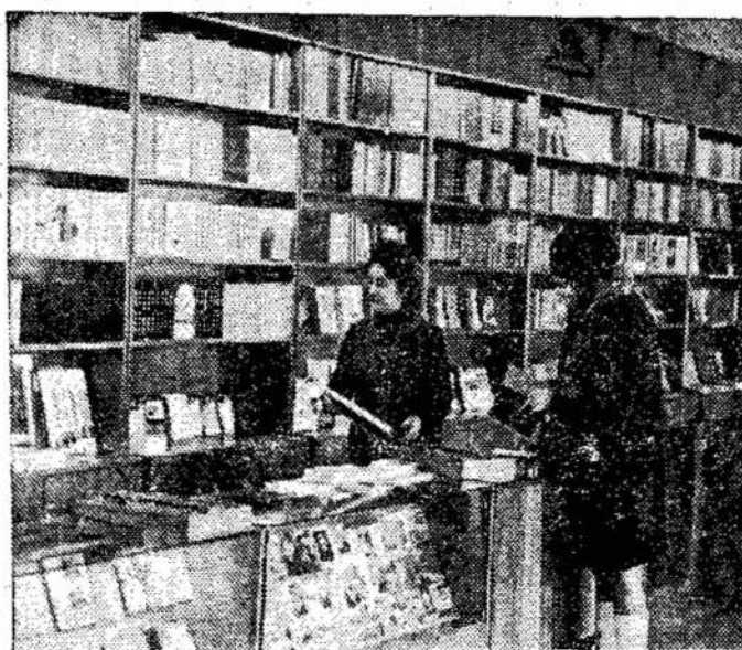
Naujame Kėdainių knygyne.

Ypatingai skaudžiai palies Laisvės ir Vilnės skaityto-