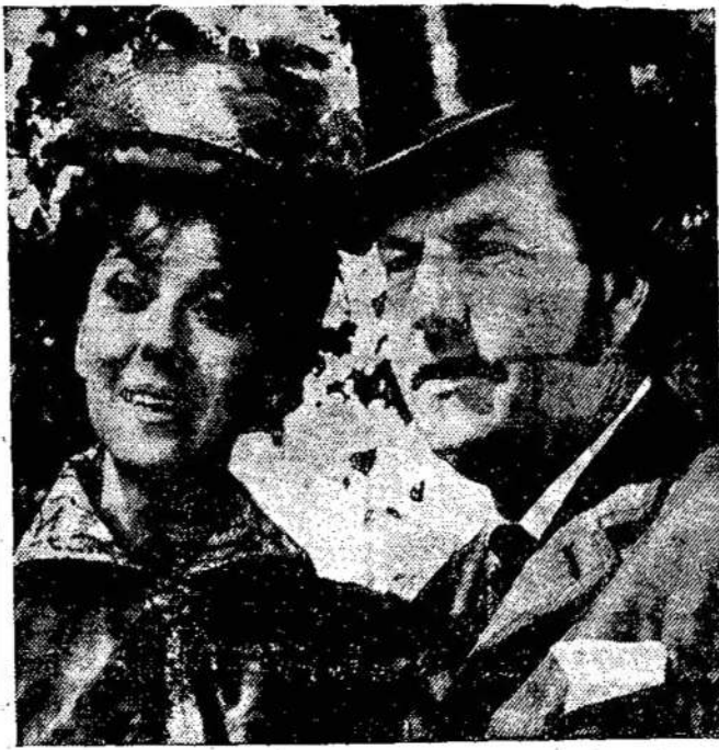
Lana Morris ir Kenneth More, kurie vaidina televizijos pastatyme "Forsyte Saga" pagal John Galsworthy apsakymą. Pastatymas eis per 26 savaites, pradedant balandžio 5 d.

BOSTON. — Grand džiuė iš naujo tyrinėti Kopechnę prigėrimą senatoriaus Kennedžio automobilyje.