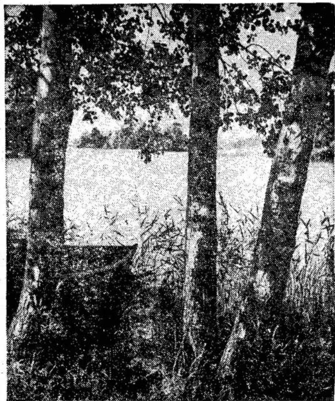
Prie Galvės ežero.