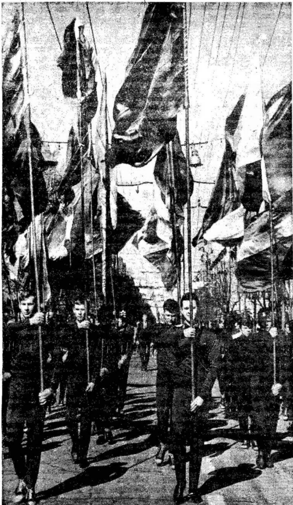
Iškilmingo parado Lietuvoje metu

Valgių buvo pridaryta per daug. Likučiai buvo iš-