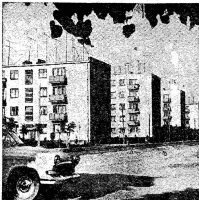
Telšiai. Naujieji gyvenamieji namai.