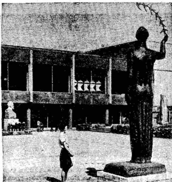
Atvira skulptūros aikštė Vilniuje, prie Parodų rūmų.