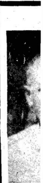
Jurgis mirė rug

atsidūrė prie duris su nedid durų, kokių š ir vieno colio buvo "duobė" rė, ir Piteris visišką tamsa telėjo, sužvie ir viskas nuti smuko ant š grindinio, — gniuždytas ir (Bus