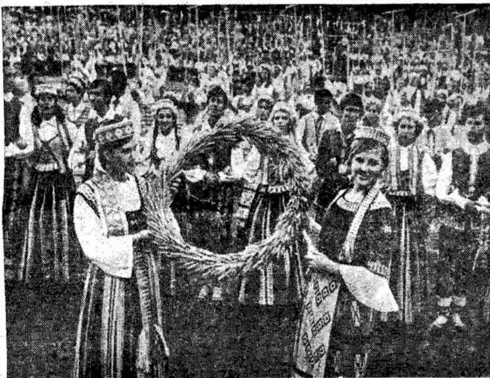
Scena iš Liaudies ansamblių vakaro Kalnų parke. (A. Brazaičio nuotrauka).