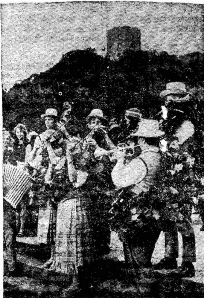
Viena Klaipėdos kaimo kapela iš uostamiesčio [Vilnių, [Dainų šventę atvyko... paprastu lietuvišku vežimu, pakeičiu surengusi keletą koncertų. pirmasis kapelos koncertas Vilniuje, Gedimino kalno papėdėje.

TORONTO. — Čia tarp tautiniame aerodrome nežinia kur dingo didelė aukso plyta, gabenama iš Edmontono į Ottawą. Aukšas vertas $24,240.