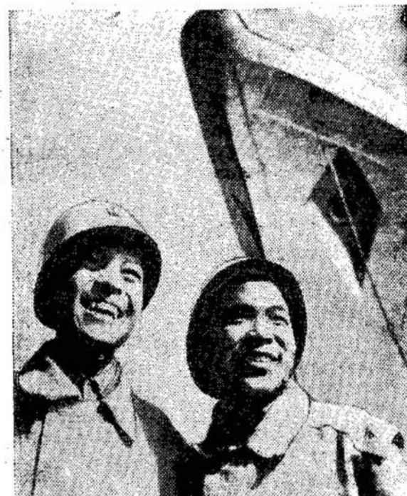
Jau metai Klaipėdoje gyvena grupė vaikinų iš Vietnamo Demokratinės Respublikos. Baikijos laivų statykloje jie įsisavina sudėtingą laivų statytojų profesiją. Išmokė šios specialybės, jie grįš į tėvynę kaip laivų statybos pradininkai.

MONTREAL. — Sakoma, kad gydytojas Sacret Heart ligoninėje paliko moterį ant operacijos stalo, užmigdytą dėl operacijos. Tai buvo padaryta ryšium su gydytojų streiku prieš medikėrą.