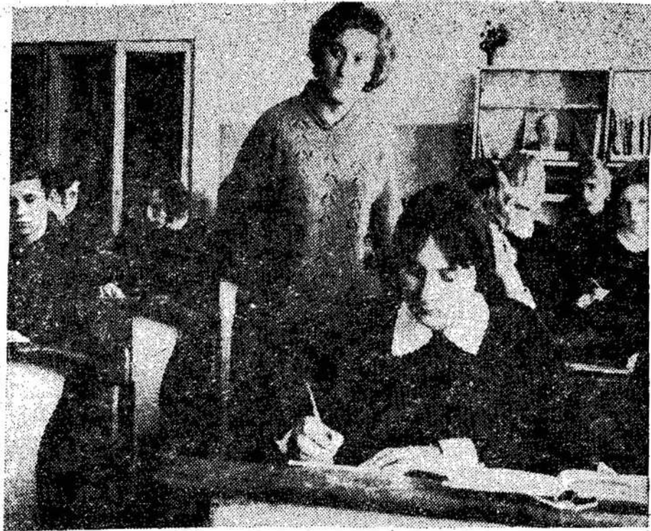
Devynioliktus pedagoginio darbo metus pradėjo šiame instituto auklėtinė dabar vadovauja Telšių rajono Žaliosios Vilties vidurinei mokyklai.

NDP ir daugelis kitų organizacijų Kanadoje mano, kad nebuvo pagrindo griebtis Karo Priemonių Akto taikos metu. Tai, žinoma, nuomonė. Gal kada nors vyriausybė išskės viršun priezastis, kurios pateisis to akto panaudojimą. Bet gali būti ir priešingai. Dabar, Kvebeko provincijos teisingumo ministras sako, kad nebūtų praktiška skelbti pavardes suimtyjų, neį gali žmonės nekaltai nuvertėti. Reiškia, gali būti suimtų visai nepateisimam. Po-