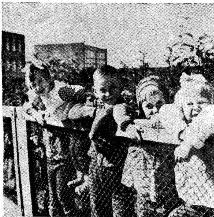
Mažieji Leopolio tarybinio ūkio vaikų darželio-lopšelio auklėtiniai.

Esą susėktas suokalbis kidnaptinti politikierius, užsienio diplomatus.