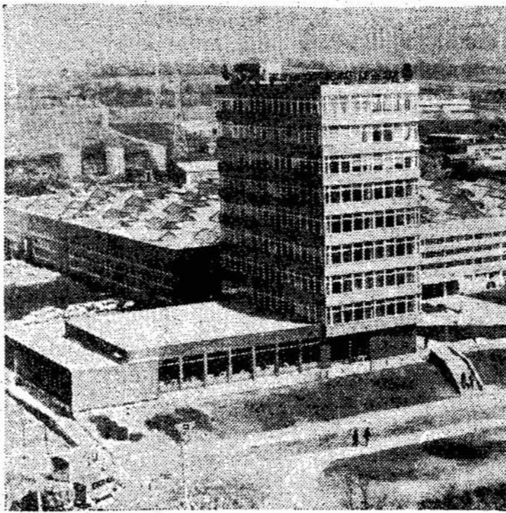
Bulgarija. Nauja gamykla Varnoje.

OTTAWA. — Kanadoje yra 900,000 vaikų, kurių abu tėvai dirba. Tik dėl 9,000 vaikų yra vietos vaikų prižiūrėjimo centruose.