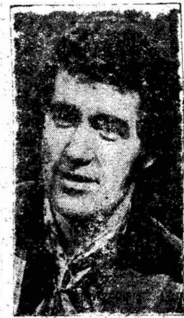
Alex Trebek, Kanados televizijos ir radio performeris.

Konkurse dalyvavo 26 rajonų ir dviejų miestų laikraščiai. Pirmoji premija paskirta Kaišiadorių rajono laikraščio "Į komunizmą" redakcijai, dvi antrosios Alytaus rajono "Komunistiniam rytojui" ir Prienų rajono "Naujam gyvenimui".