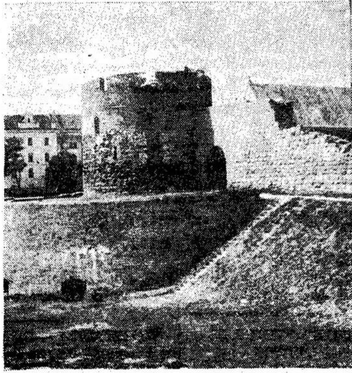
Štai kaip dabar atrodo Kauno pilis.