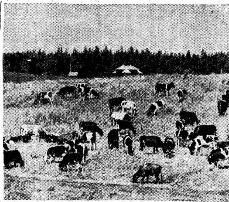
Platelių kolūkio galvijai lankose.

Įvykiai Rytų Pakistane nemažai bėdų atnešė ir Indijai. Ne tik kad tenka rūpintis milijonais pabėgėlių, bet ir grumtis su cholera, kuri atsirado pabėgėlių tarpe.