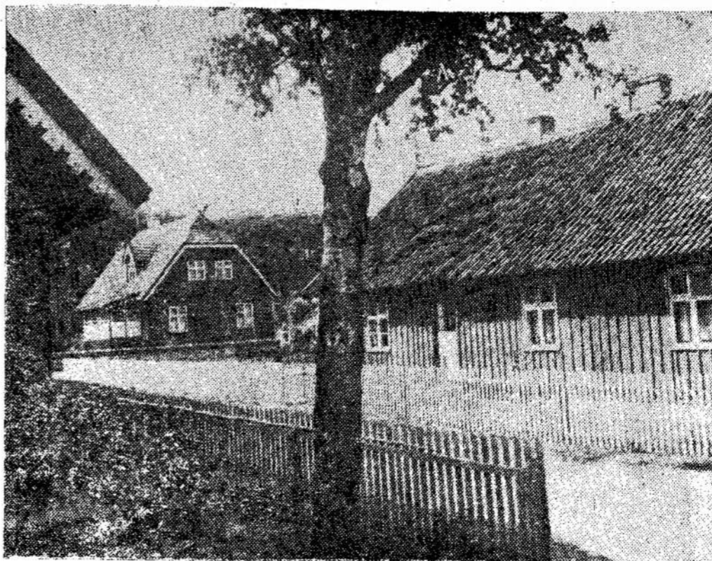
Nidos etnografinis kampelis. M. Melnikaitės gatvė.

Reikia pasakyti, kad LB skaitytojai yra tolerantiškiausi. Bet pasitaiko tokių, kurie kaltina laikraštį, jeigu, pavyzdžiui, negauna vizitoriaus vizos Lietuvon, jei neduo-