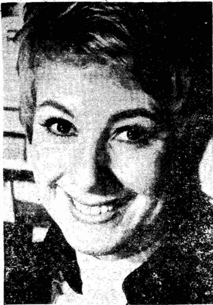
Dainininkė ir aktorė Shirley Jones, kuri matoma televizijos programoj Partridge Family.