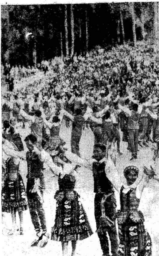
Penktoji tradicinė Pabaltijo respublikų studentų šventė šiemet įvyko Rygoje. Joje dalyvavo 2,000 Lietuvos aukštųjų mokyklų studentų.

Klaipėda. — Per ketvirtį amžiaus Klaipėdos jūrų universiteto mokykla paruošė beveik 4,000 laivų vairuotojų, statytojų, mechanikų ir kitų specialistų. Jie dirba įvairiuose Vakarų, Šiaurės, Toli-