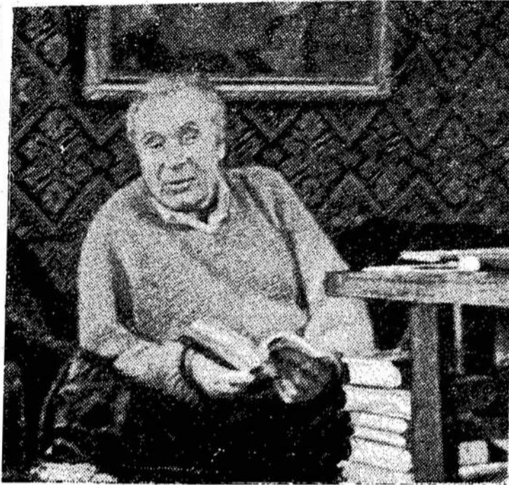
Lapkričio 29 d. rašytojui Juozui Grušui sukako 70 metų.

Šventiniai sveikinimai laikinai išmuše mus iš vėžių. Daug raštų užsivėlino, kiti nusitęsė. Bet dabar jau bus