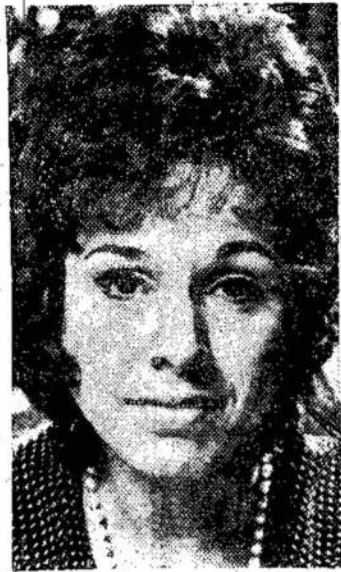
Barbara Frum, Kanados televizijos ir radio darbuotoja.

Kad palaikyti šią tokią su Amerikos doleriu lygsvarą spausdino daugiau popierinių pinigų ir sąjungininkės. Nueik į Kanados banką, čekį iškeist ar pasiskolinti pinigų, išima pinigų pluoštą, kaip plytą, penkinės, dešimkės ir dvidešimtinės, tik iš spausdintuvės sulipę net išskirti sun-