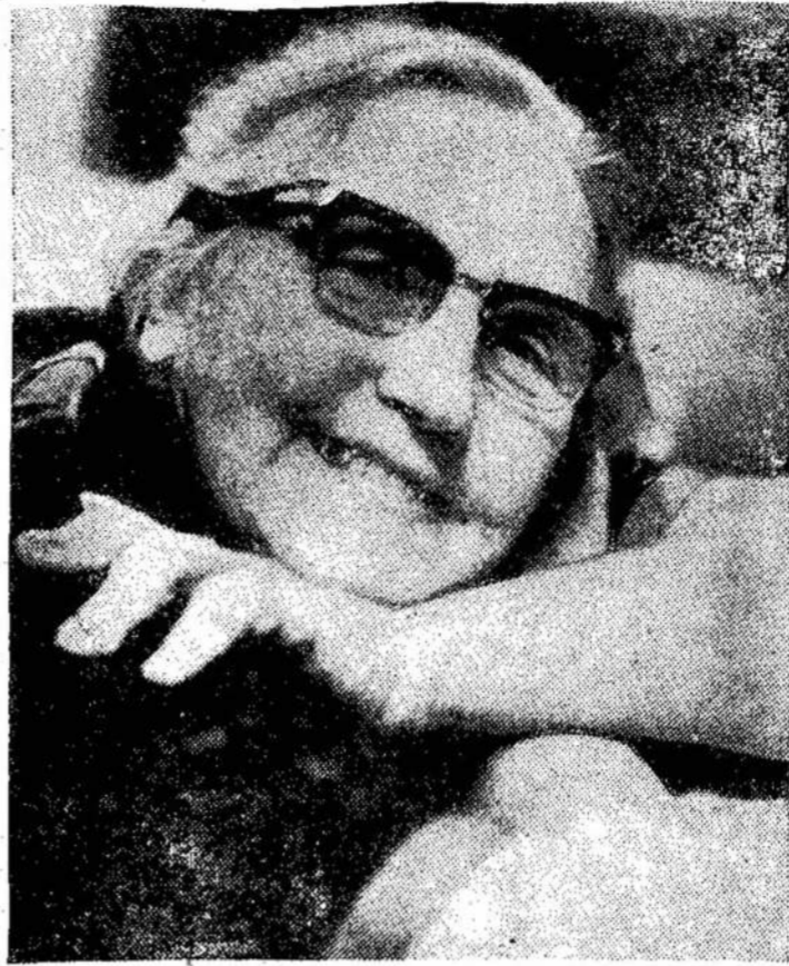
Rašytoja Ieva Simonaitytė. Tarybų Lietuvos visuomenė šių metų sausio mėnesio pabaigoje gražiai paminėjo jos 75-ąsias gimimo metines.

Turtingiesiems ne taip jau ir skaudu, kad šimtai tūkstančių be darbo. Juk jiems nereikia jais rūpintis, valdžia visų žmonių takais juos išlaiko. Net ir tų, kurie galo su galu nesuveda.