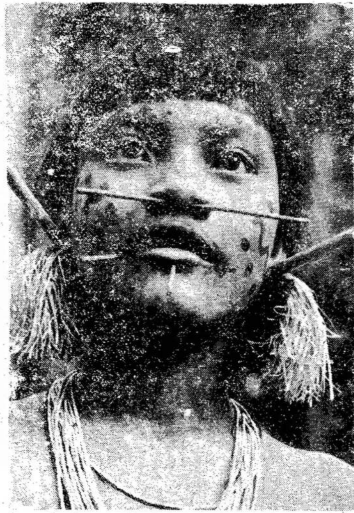
CBC televizija sausio 31 davė visos valandos programą apie vieną Pietų Amerikos gentį, vadinamą Janomami vardu. Nuotraukoje matote vieną tos genties narį. Ta gentis esanti beveik nepaliesta civilizacijos. Gentis turi labai keistus papročius ir tradicijas.