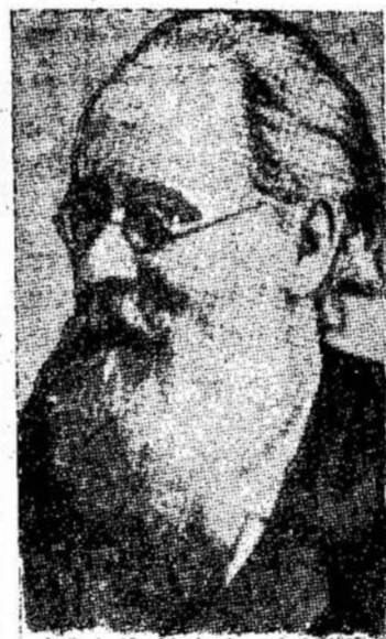
L. Lansbergis-Zemkalis (1852-1916)

Sukanka 120 metų, kai gimė Gabrielius Landsbergis-Zemkalis, lietuvių teatro veikėjas, dramaturgas, publi-cistas.