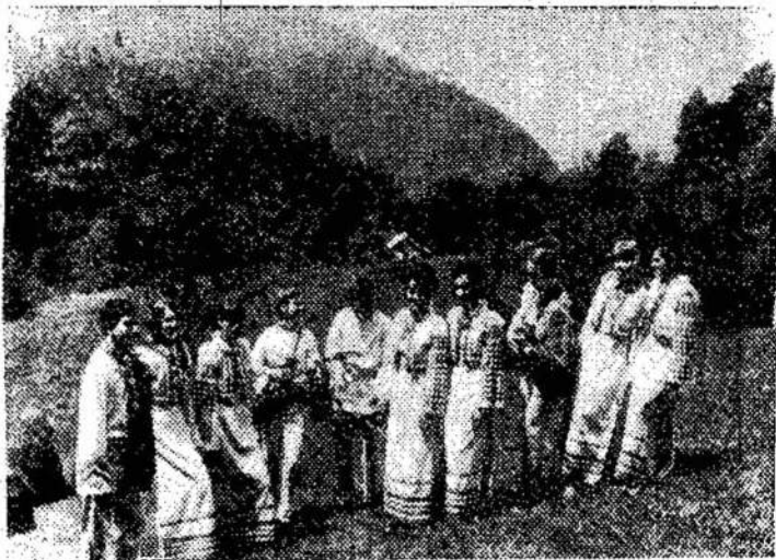
Ukrainiečiai pasipuošę tautiniais drabužiais.

Nemaža Kriaučiūno auklėtinių baigė arba mokosi