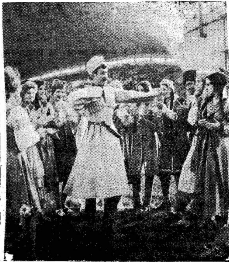
Vilniaus miesto dainų šventė. Saviveiklininkų grupė, pasipuošusi broliškųjų respublikų tautiniais rūbais.