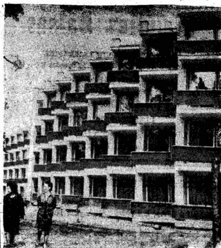
Palanga laukia poilsiautojų.

Mano supratimu, tai gal būtų tinkamiausia tai padaryti pačiam sumanytoji. Jis yra populiariausias Londone. Vienas iš 70-mečių London, Ont.