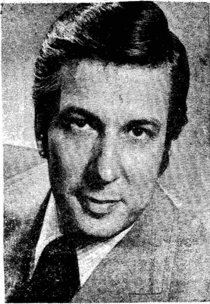
Lloyd Robertson, CBC žinių pranešėjas.