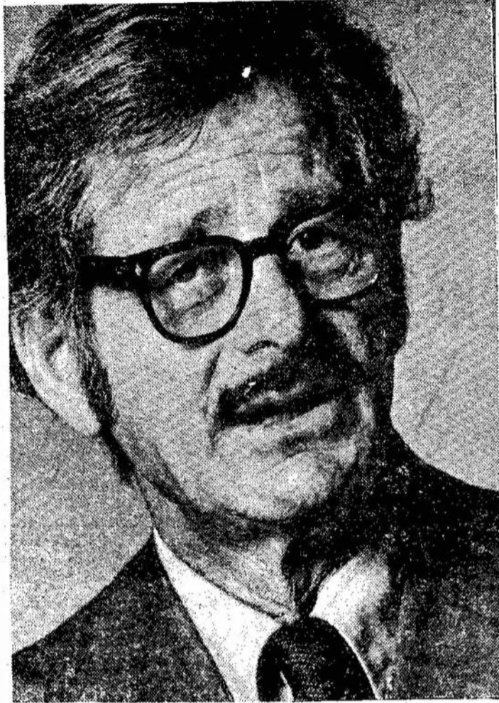
Žymus amerikiečių impersario-dramaturgas Norman Corvin, kurs stato televizijoje trumpas dramas po užvadinimu "Norman Corwin Presents".