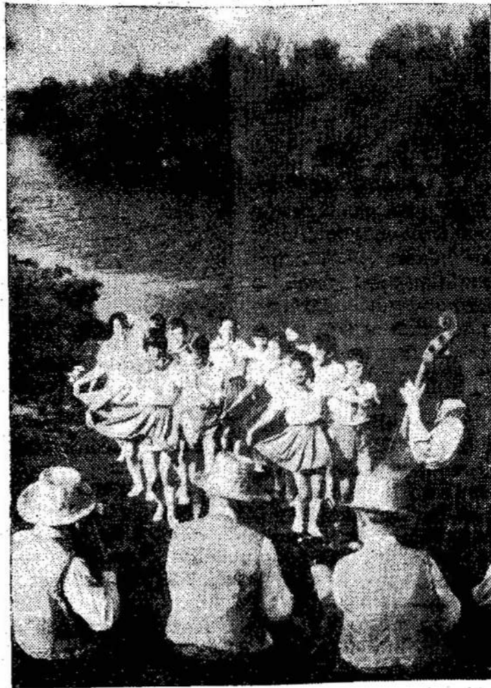
Nuotraukoje: moksleivių gegužinė Nevėžio pakrantėje.

Viešnagėn ansamblių buvo pasikvietusi Suomijos-TSRS draugystės draugija. Ansamblio koncertai įėjo į tradicinio tarptautinio meno festivalio programą.