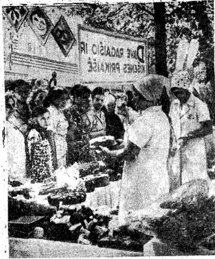
Tokiais štai gardumynais buvo prekiaujama liaudieskoje mugėje, kuri per liaudies ansamblių šventę veikia Kaune, Laisvės alėjoje.