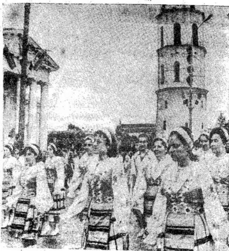
Liaudies ansamblių šventė. Nuotraukoje: šventės dalyvių eiseną senojo Vilniaus gatvėmis