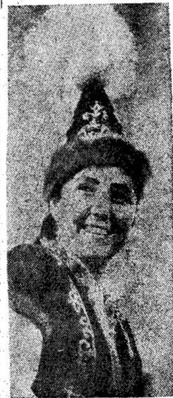
TSRS Valstybinės ir Kazachijos TSR respublikinės premijos laureatė, TSRS liaudies dainininkė Bibi Gul Tulegenova.

Jeruzalim. — Rabinas Meir Kahane, Žydų Apsigynimo Lygos lyderis Jungtinėse Valstijose, pareiškė, kad lygos nariai JAV kidnapins Tarybų Sąjungos diplomatus ir laikys juos tol, kol Tarybų Sąjunga panaikins mokesčius, imamus iš žydų intelektualų, norinčių emigruoti į Izraelį.