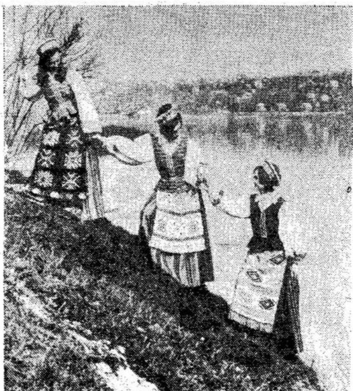
Dailios Lietuvos mergaitės, pasidabinusios tautiniais drabužiais.

Port Stanley yra netoli St. Thomas, Ont.