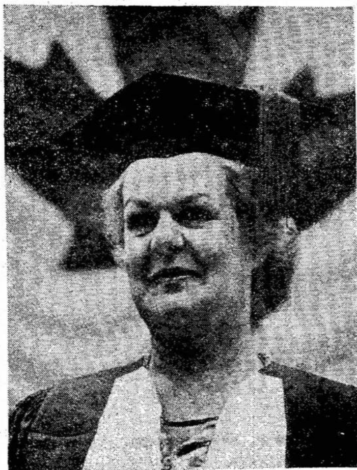
Maureen Forester, pagarsėjusi dainininkė, kuri buvo apdovanota garbės daktaro laipsniu York Universitete, Toronte.

Nereikia būti to sporto žinovu, kad nesuprastum, jog