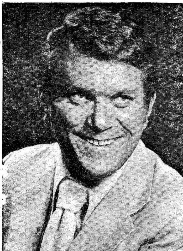
Tommy Hunter, populiarus Kanados dainininkas. Jo programa ant televizijos būna kiekvieno penktadienio vakare nuo 9 valandos vakaro.

Kaip atrodo, tai Ontarijos hydro darbininkų streikas užsitęs labai ilgai. Kuri pusė čia kalta, kol kas neaišku.