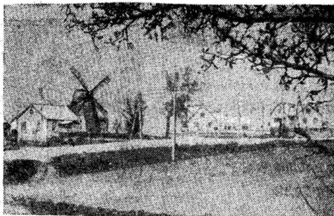
Alytaus rajono žuvinto kolūkio gyvenvietė.

Havana. — Jamaica, Gvatemala, Barbados, Trinidad ir Tobago nutarė užmegsti diplomatinis ryšius su Kuba.