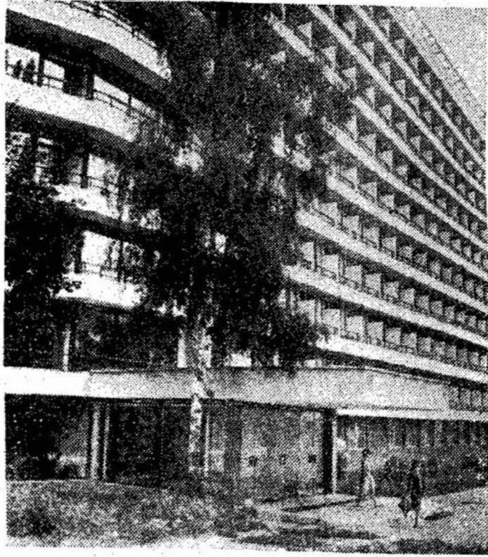
Druskininkų "Nemuno" sanatorija.

Protėstoniškų bažnyčių vyskupai turėjo pasitarimą, kuriame, tarp kita ko, jie svarstė ir tai, kaip "nužengti iš dangaus ant žemės". Tai yra, suderinti savo kasdienį gyvenimą su žmonių, kuriems jie skelbia, kad drambliai