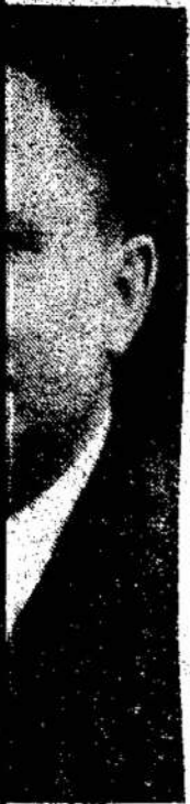
vienas iš di- nes Balso pa- vės montrea- jojasi kiekvie-