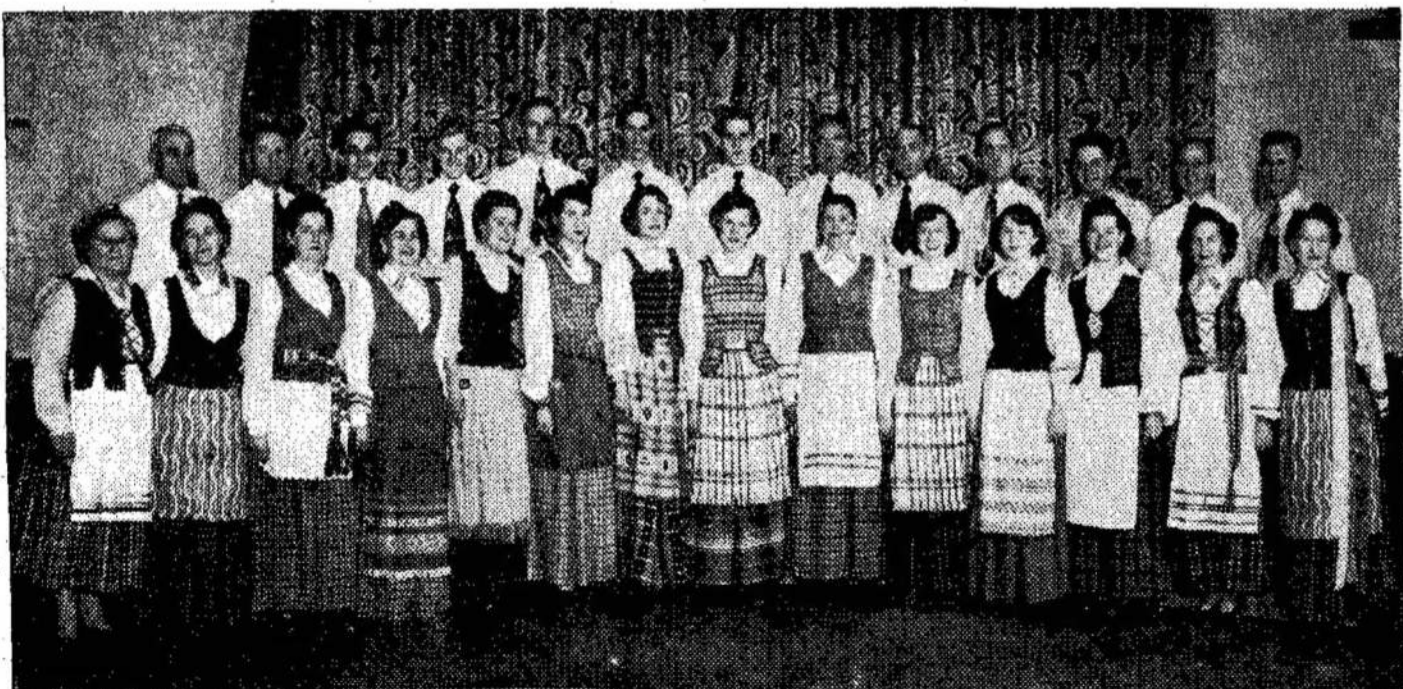
Toronto lietuvių choras daug padėjęs ir Liaudies Balsui, pildydamas jo parengtą meninę programą. Didelę kultūrinę rolę jis suvaidino lietuvių gyvenime. Lankėsi ir kitose Kanados vietovėse. Taipgi Ročesteryje ir Čikagoje, kur laimėjo gražų atžymėjimą.

Baigdamas noriu prisiminti ir pažangius amerikiečius lietuvius. Be jų politinės, moralės ir ekonominės paramos, Liaudies Balsas nebūtų buvęs toks stiprus, koks jis buvo, ir nebūtų galėjęs tiek Kanados lietuviams, darbo žmonėms, patarnauti, kiek jis pasitarnavo.