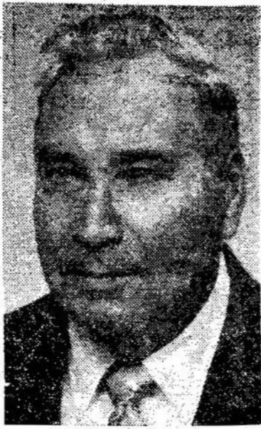
Jie taipgi yra daug veikę lietuvių organizacijose ir meninėje srityje, gyvendami Toronte.