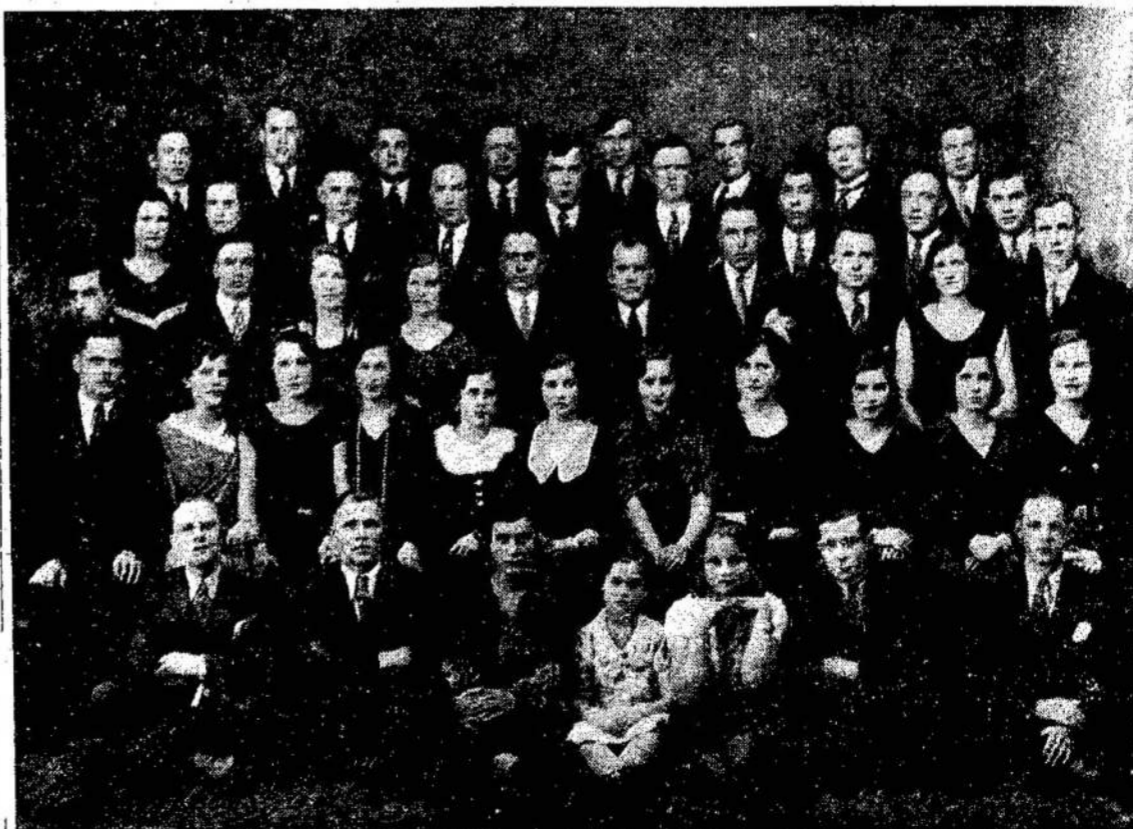
Montrealo Lietuvių "Jaunimo" choras, 1932 metais.