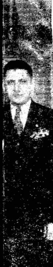
Stovi: J. Bro- J. Yla ir Mikas

Lietuvos, ir arbo žmones. Petrauskas gystės ir kul- u užsienio ša- pirmininkas.